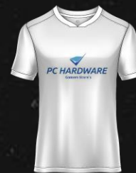
VIDABLE CASTRO F. S