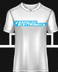
NEPTUN CORP S.A