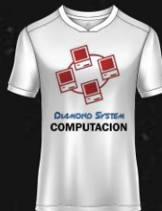
DYAMOND SYSTEM S.A