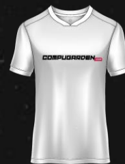
GRUPO MAXIMUS S.R.L