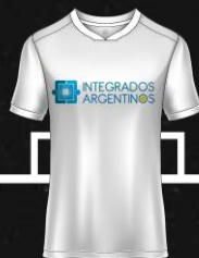
GRUPOS INTEGRADOS S.A