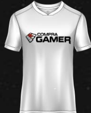
NEWTON STATION S.R.L