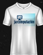
JAR COMPUTACIÓN S.R.L