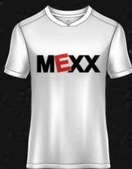
ORTIZ DE GUINEA D.