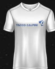
TACCO CALPINI S.A