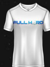
SEGAL G. A.